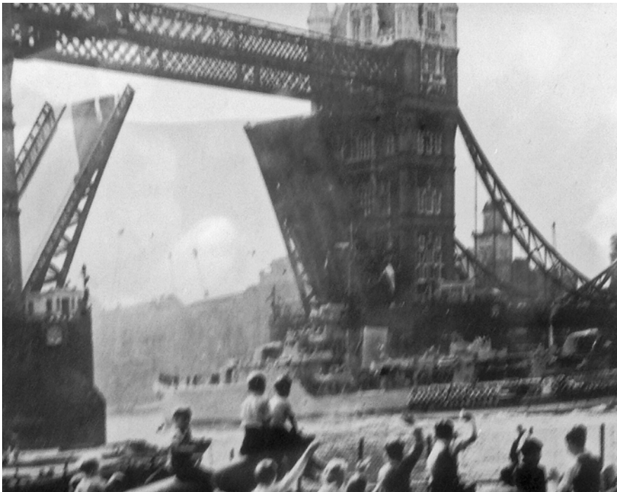
KNM Bergen på vei mot Tower Hill sommeren 1950.